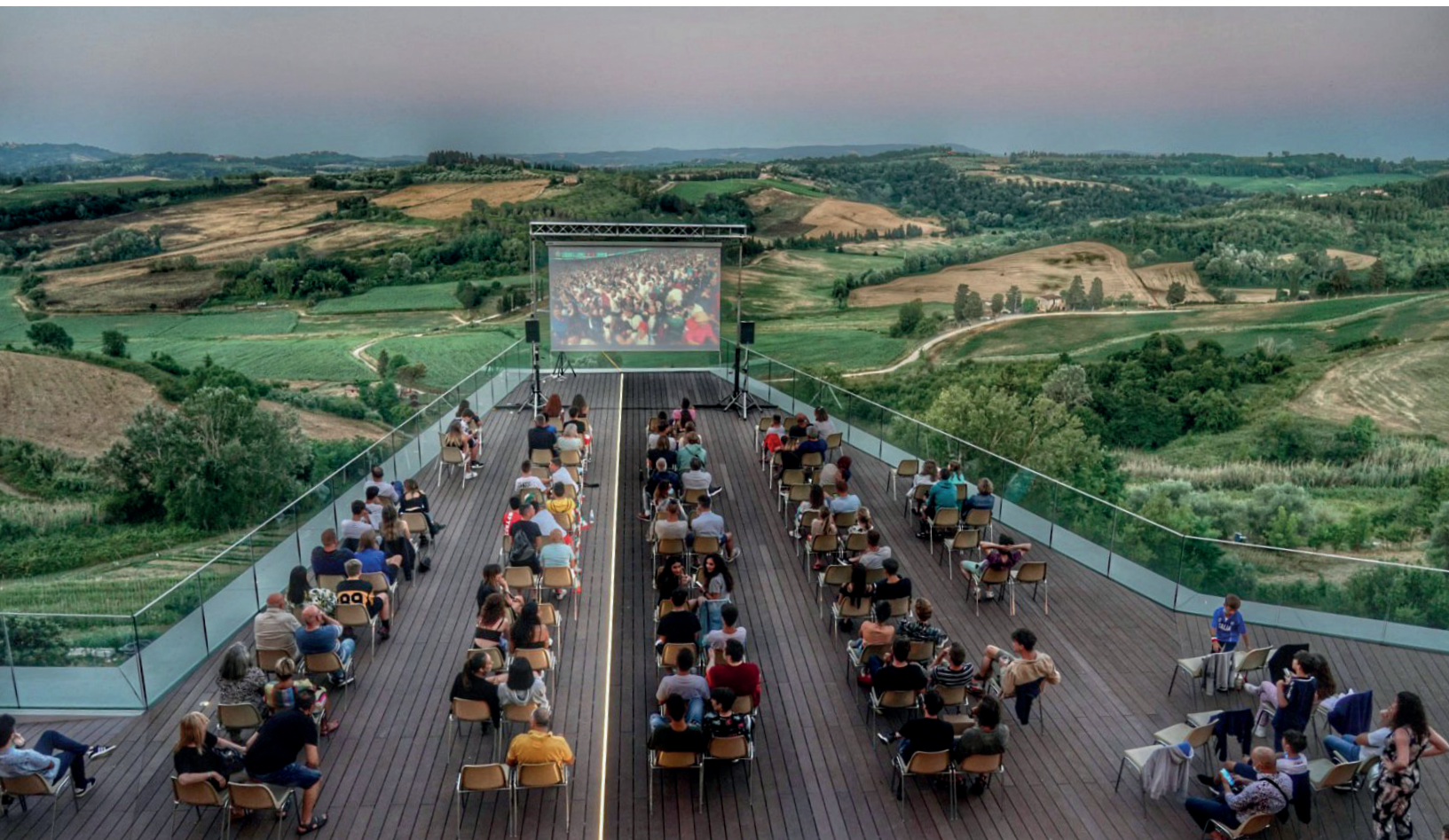
Il maxischermo per la finale di Euro 2020 allestito sulla terrazza sospesa del Palazzo Senza Tempo

Edizione a cura dell'Amministrazione Comunale