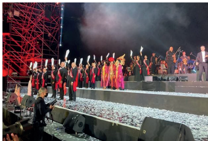
La prima delle due serate del Teatro del Silenzio di Lajatico

Una visione che ha portato e sta portando a grandi risultati e a esperienze uniche. Un sistema, quello di Peccioli, che ha saputo guardare in avanti, ha saputo vedere nel futuro, e la sua accademia musicale ne è una testimonianza. Un'accademia che è stata il cuore pulsante anche in mezzo al periodo più duro della pandemia, continuando a esistere e a infondere non solo cultura ma speranza».