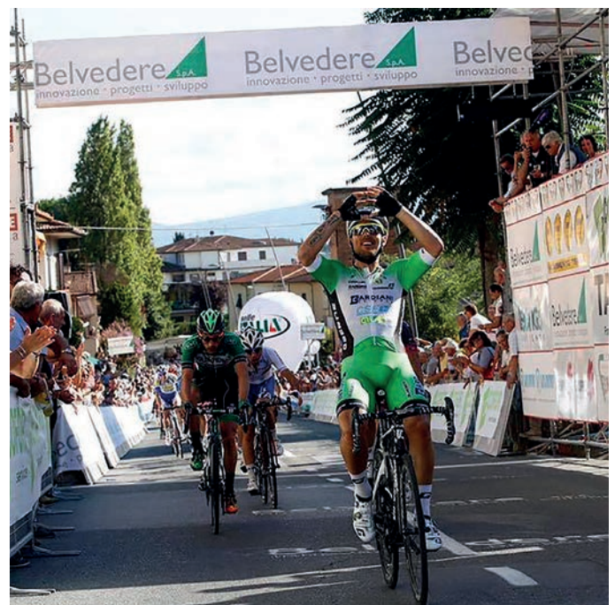
L'arrivo in volata della Coppa Sabatini in via Mazzini

I lavori, iniziati a luglio, termineranno a settembre. Dal civico 21 al civico 35 è istituito il senso unico alternato con impianto semaforico. Istituito il divieto di sosta con rimozione coatta nel parcheggio a disco orario antistante l'ingresso del parcheggio multipiano.