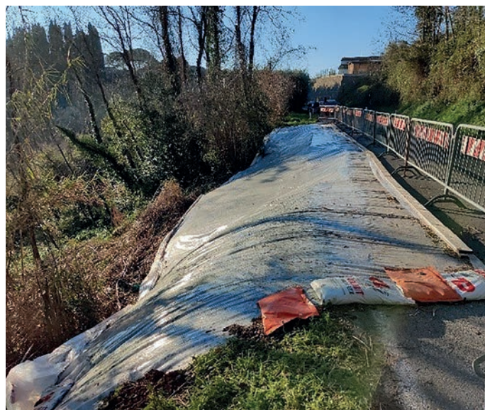
La frana lungo la via comunale di Fabbrica oggetto dei lavori di messa in sicurezza

L'intervento ha previsto la messa in sicurezza della strada nell'area compresa tra il cimitero di Fabbrica e la località podere Poggetto a quota variabile tra i 140 e i 150 metri sul livello del mare. Lungo il tratto il tracciato, per un totale di 130 metri, è stato spostato lato monte. E la nuova sede stradale sarà costituita da due corsie, con relative banchine, per una larghezza totale di 6,5 metri. Effettuati scavi nel pendio per ricavare spazio alla nuova sede stradale, creando una scarpata leggermente inclinata per dare stabilità a quest'ultimo. In meno di cinque mesi dallo smottamento, dunque, è stato dato avvio all'opera di risanamento.