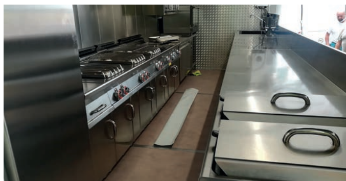
La "Cucina di Peccioli" subito al lavoro per la Notte dei Giganti