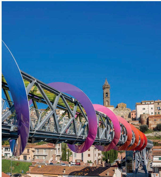
La passerella "Endless sunset" dalla quale partirà il collegamento verso la Fila

La prima passerella in via Mazzini, lunga 136 metri e che si collega al parcheggio multipiano, è pronta a entrare in servizio nelle prossime settimane. E si aggiunge al progetto di un secondo parcheggio multipiano e di una seconda passerella sospesa per collegare il nuovo parcheggio al centro storico di Peccioli nell'area di via dei Cappuccini, dove è già presente una zona di sosta. Da lì partirà un sovrappasso che porterà in piazza del Carmine, per questo primo lotto di lavori è già stato assegnato alla ditta. Ora questo passaggio fondamentale per la terza passerella e per creare un sistema pedonale aereo in quota che permette il superamento di ogni barriera architettonica.