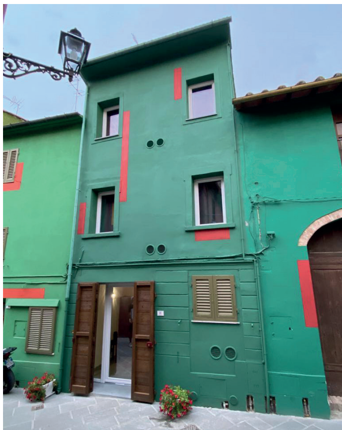
L'ingresso del b&b aperto in via di Mezzo a Ghizzano