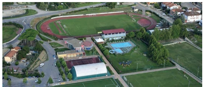
Gli impianti sportivi "Alfredo Pagni"

gestire le attività della nuova struttura. Per ultima, ma di certo non meno importante, la Fondazione Peccioliper. L'associazione senza scopo di lucro impegnata nella promozione culturale e artistica, ma anche nella tutela della natura e dell'ambiente fino al sostegno della lotta contro l'handicap e la disabilità, sosterrà e parteciperà alla realizzazione del progetto. Lavorando attivamente alla promozione di eventi e all'aspetto di comunicazione e marketing delle attività correlate alla nuova piscina.