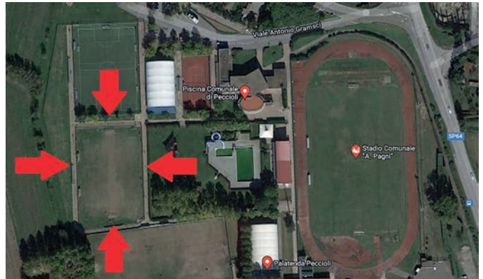
L'area dove sorgerà la nuova piscina coperta di Peccioli.

La Uisp Comitato Valdera è già concessionaria dell'impianto piscina, campi da tennis e fabbricato polifunzionale e, tra le proprie finalità statutarie, ha lo scopo di favorire comportamenti salutari nella popolazione di tutte le fasce di età, promuovendo il movimento e l'attività fisica, agevolando la pratica sportiva e la diffusione della cultura sportiva, in particolare tra i giovani. L'associazione, dunque, si è resa subito disponibile a co-finanziare e