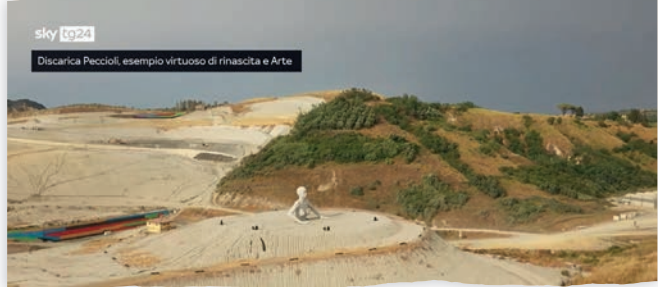
Discarica Peccioli, esempio virtuoso di rinascita e Arte

"Sistema Peccioli", quello culturale e artistico, presto vedrà accendersi i riflettori per il festival ILLune.