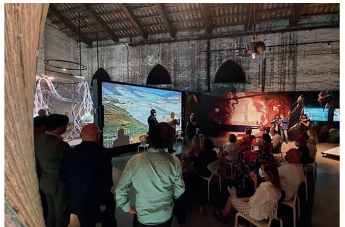
Un momento della presentazione del progetto "Voci" alla Biennale

Una prima delegazione, composta da consiglieri comunali e mem-