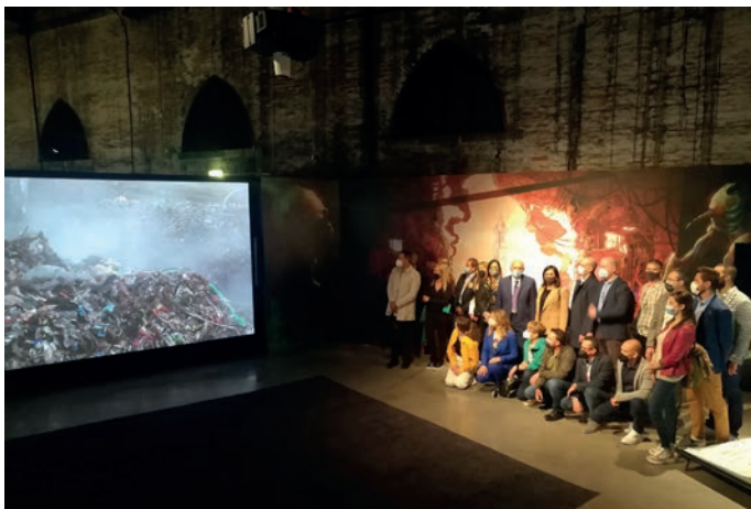
La prima delegazione pecciolese ospite al "Laboratorio Peccioli" a Venezia

I rifiuti di una discarica che diventano installazione artistica. Scenografia, unita a video, grafiche e disegni, a formare il "Laboratorio Peccioli". Un collage che, all'interno della mostra internazionale di architettura, a Venezia ospita tutti gli eventi organizzati nei sei mesi di esposizione nel Padiglione Italia.