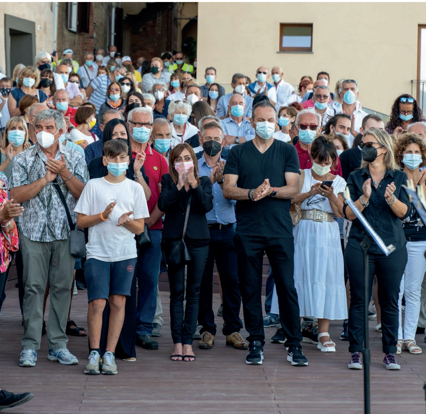
Le immagini simbolo dell'inaugurazione del Palazzo Senza Tempo