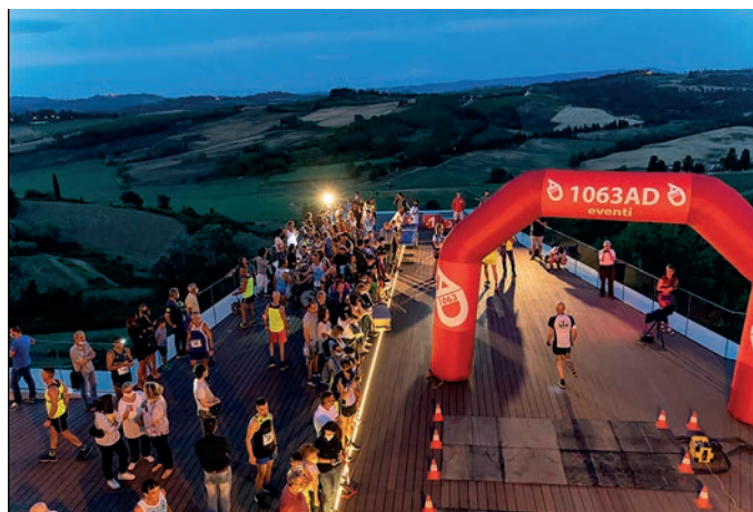
Il traguardo sulla terrazza sospesa del Palazzo Senza Tempo