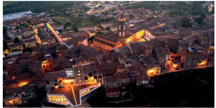
Il borgo illuminato visto dal drone

Ai "borghi arancioni", poi, la seppur breve stagione estiva 2020 è andata meglio che altrove. Infatti, nonostante il crollo mondiale del turismo nell'ultimo anno e mezzo dovuto al Covid, per il 66% dei Comuni Bandiera Arancione la stagione estiva 2020 è stata in linea e, in molti casi, migliore dell'anno precedente. Anche per l'estate 2021 le previsioni sono molto promettenti e i borghi, che sanno essere laboratori di innovazione, sapranno rispondere in modo ospitale e creativo, accogliendo i viaggiatori - principalmente italiani - che li visiteranno. Insieme al Touring Club, poi, l'amministrazione ha approntato una nuova segnaletica e in progetto ci sono delle archigrafie che miglioreranno ancora la "fruibilità" del borgo e delle frazioni come località turistiche di eccellenza. Altri progetti sono in dirittura di arrivo, come quello del Peccioli Working Village che vedrà, a settembre, alcuni professionisti trascorrere 9 giorni di village-working nel nostro Comune. Un riconoscimento, quello della Bandiera Arancione, che durerà fino al 2023 quando ne sarà celebrato il ventennale.