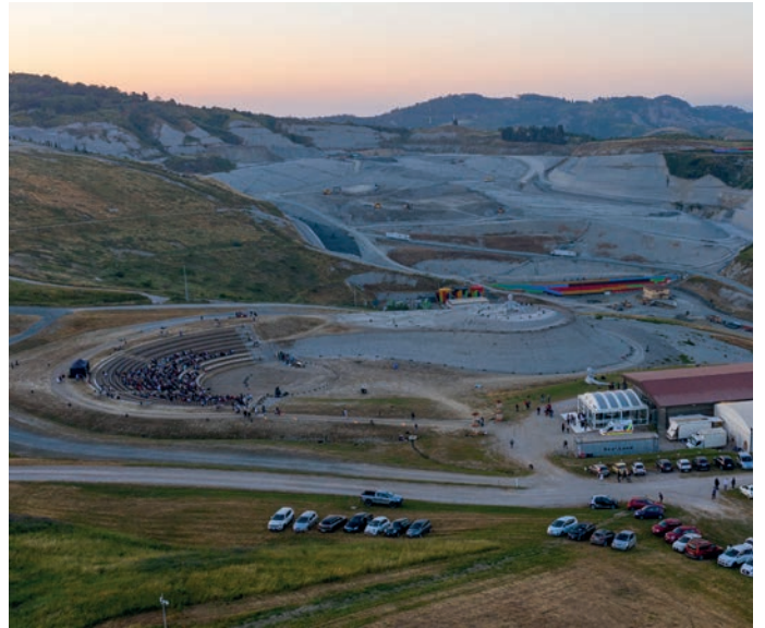
Un evento organizzato alla discarica di Legoli

La celebrazione del matrimonio sarà subordinata, ovviamente, alla disponibilità degli operatori dell'amministrazione comunale, degli spazi richiesti e al versamento, se ricorre il presupposto, di