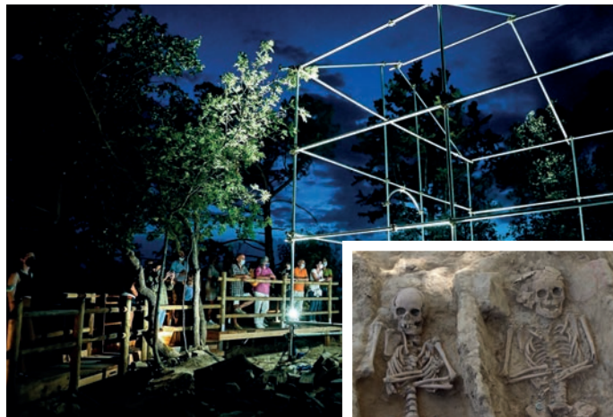
Un momento della visita allo scavo di Ghizzano e nel riquadro il ritrovamento delle sepolture di due dei tre fratellini uccisi, forse, da un'epidemia

La particolarità di questa scoperta sta nel fatto che questa tomba multipla (due sepolture sono insieme a una terza posta a un livello leggermente inferiore) possa appartenere a tre componenti giovanissimi, due maschi e una femmina, della stessa famiglia. Pro-