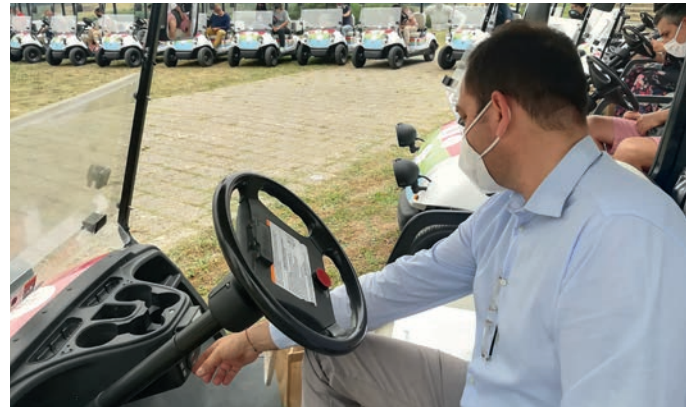
La consegna dei mezzi elettrici ai commercianti all'Anfiteatro Fonte Mazzola