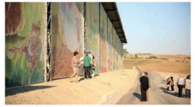
A Legoli è spesso ospitata anche l'arte: qui le opere di Staino

Peccioli (Pisa), 24 luglio 2021 - A Peccioli sarà possibile sposarsi anche in discarica. Lo prevede il nuovo regolamento sui matrimoni approvato dal consiglio comunale di Peccioli, realtà della Valdere la cui discarica è considerata un impianto modello e al cui interno è stato ricavato anche un anfiteatro.