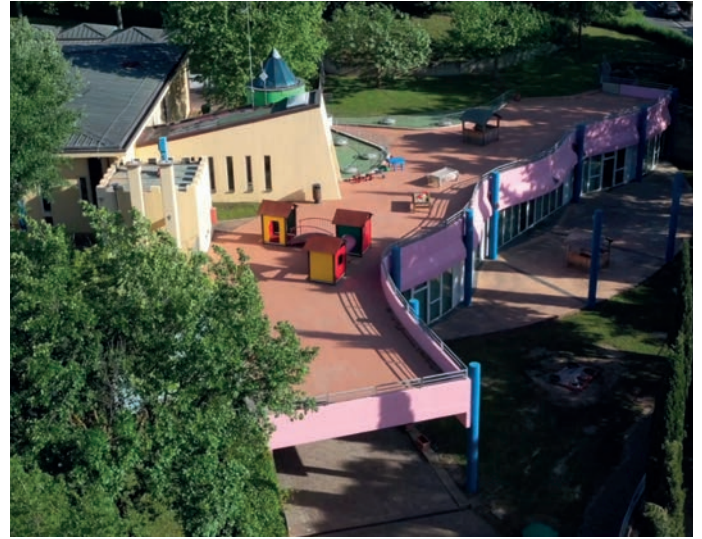
Una vista dall'alto di come appare oggi il nido "Staccia Buratta".

A 40 anni da quel taglio del nastro, il nido "Staccia Buratta" conta 65 bambini iscritti. Molti di questi sono figli di pecciolesi che, a loro volta, sono stati piccoli alunni di questo importante centro educativo. Che si è evoluto, arricchito e ora è uno di quelli considerati, non solo nella Valdera ma in tutta la Toscana, all'avanguardia. E il Comune di Peccioli dedicherà a questa ricorrenza così importante una serie di iniziative che culmineranno, nel 2022, con un evento speciale dedicato proprio a questo lungo e importante percorso.