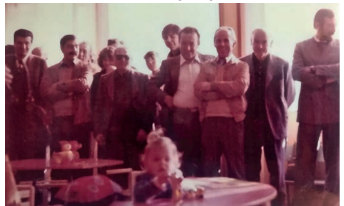
I cittadini scoprono lo spazio dedicato ai bambini pecciolesi.