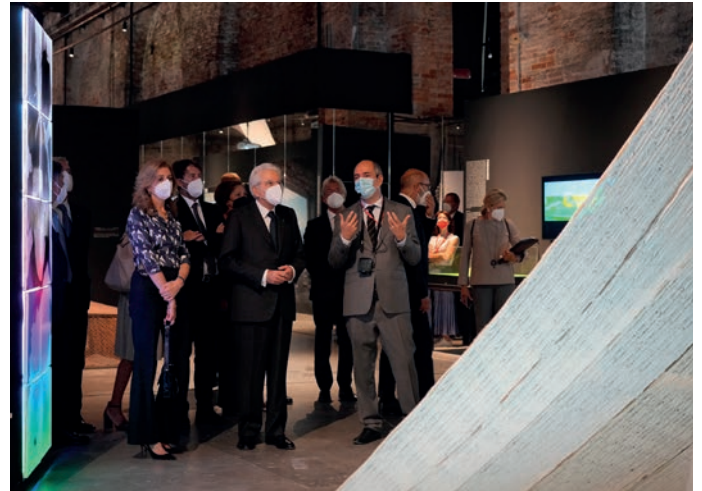
Visita di Sergio Mattarella al Padiglione Italia alla Biennale Architettura 2021

Una visita che è stata una sorta di fuori programma, visto che Mattarella era a Venezia per intervenire alla Mostra Internazionale del Cinema di Venezia. Ma fortemente voluta per dare un segnale, con un suo passaggio al Padiglione Italia, al Paese proprio in un'ottica di rinascita e ripartenza dopo le difficoltà legate alla pandemia.