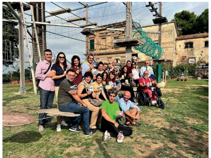
Lo scatto di gruppo al termine del "Peccioli Working Village"