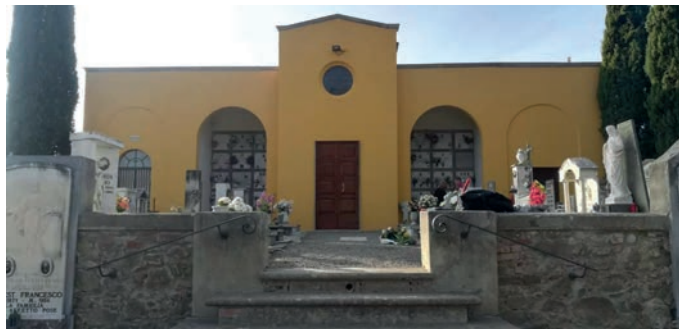
La vista del cimitero di Montecchio dall'ingresso principale.