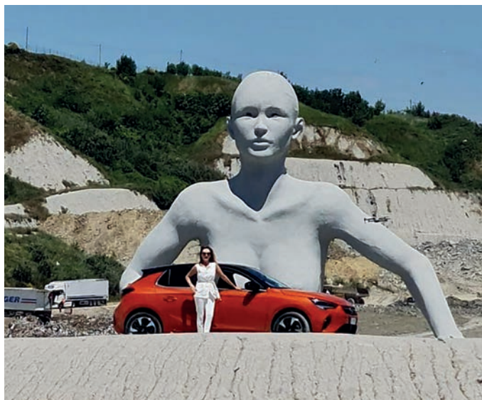
La conduttrice di Tg2 Motori Maria Leitner alla discarica di Legoli

La si può considerare una vera e propria forma di promozione territoriale. E il fatto che uno dei format televisivi sul mondo dei motori più longevi e seguiti della tv italiana da un lato, e un marchio motoristico che rappresenta il Made in Italy in tutto il mondo dall'altro abbiamo scelto il nostro territorio per promuovere i loro prodotti e il loro brand significa che Peccioli ha intrapreso la strada giusta.