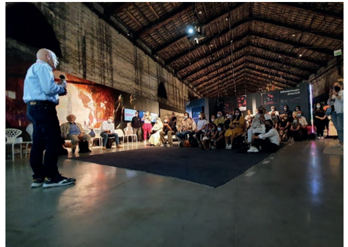
Uno degli eventi organizzati al Laboratorio Peccioli, cuore del Padiglione Italia.