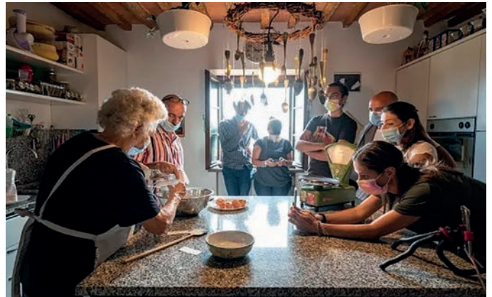
Uno dei laboratori ai quali i villagers hanno preso parte