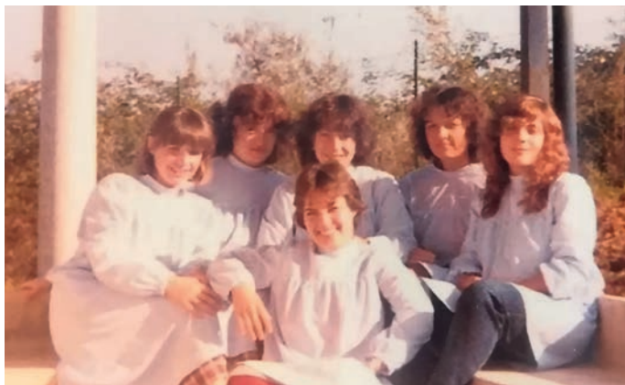
Il 7 novembre 1981 il nido apre e dà lavoro a sei dipendenti, tutte donne.