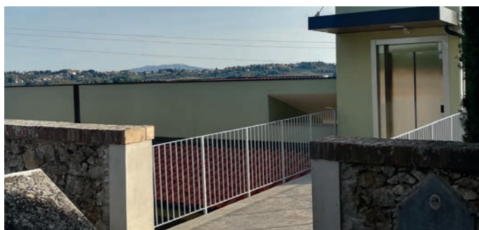
Ascensore e passerella che collegano la parte nuova a quella storica del cimitero.