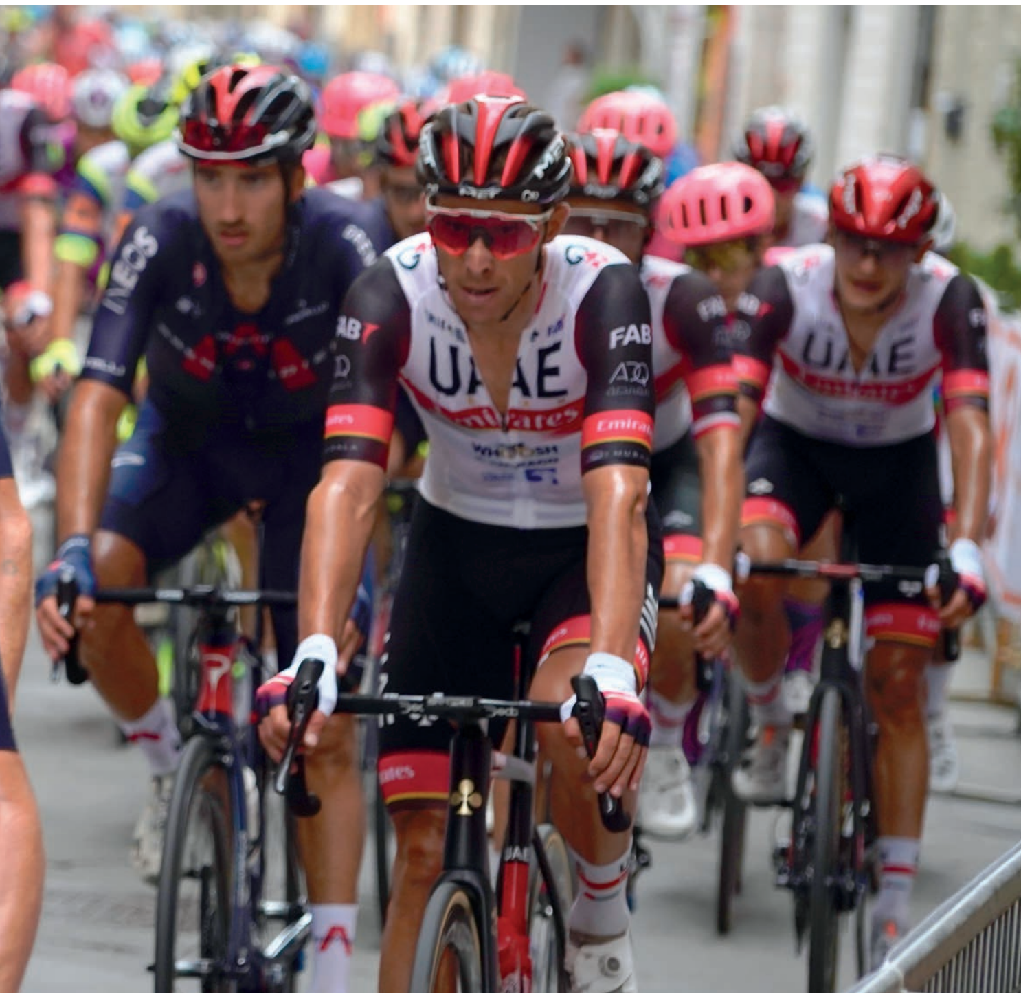
Le immagini simbolo della Coppa Sabatini 2021